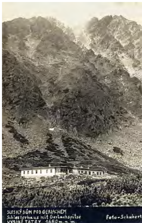
SLIEZSKÝ DŮM POD GERLACHEM Schlesierthaus mit Gerlachspitze VYSOKÉ TATRY, 1660 m. n. m.