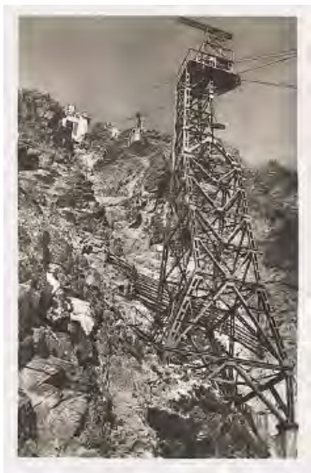
9 Foto „CENTRUM“ – lanovka pod Lomnickým štítom, ftopohľadnica z roku 1943, 6. séria, výrobca neznámy