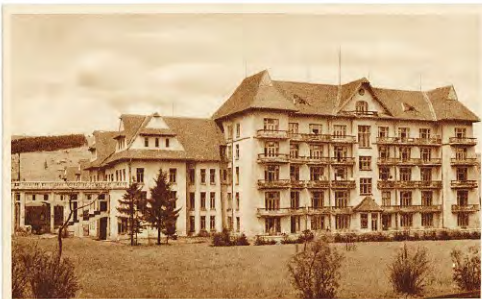
ZAKOPANE. Sanatorium Czerwonego Krzyża.